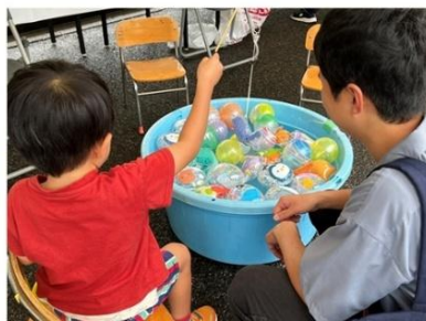
過去の酒蔵開放のようす