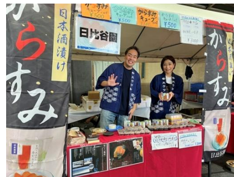
△日比谷園 (からすみ)