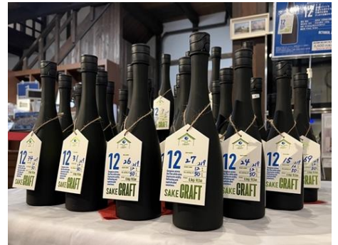
△HAKUTSURU SAKE CRAFT No. 12