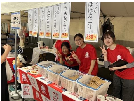
△カネテツデリカフーズ