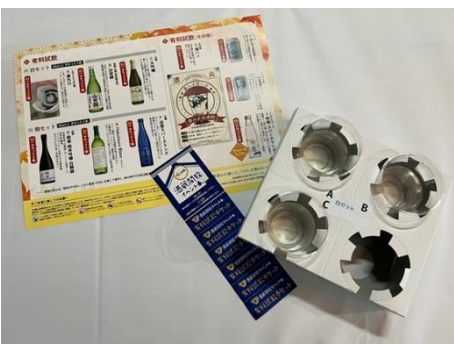
△有料試飲（垂れ口、Hakutsuru Blanc、淡雪スパークリングなど）