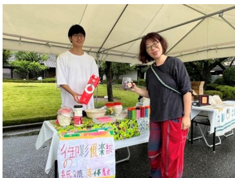
△御影倶楽部によるサケパックの紙すき体験