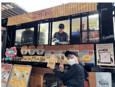
△キッチンカー (アンコムチュア・THEO)