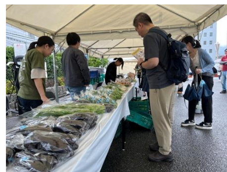
△神戸の野菜販売 (小池農園こめハウス・おざき農園・おしベジタブル)