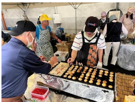
△呉田まちづくりの会模擬店