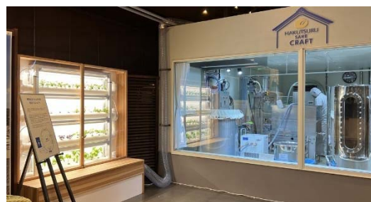
<左：室内農業装置、右：HAKUTSURU SAKE CRAFT>